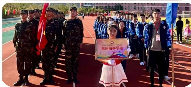
泉州台商投资区中小学田径运动会